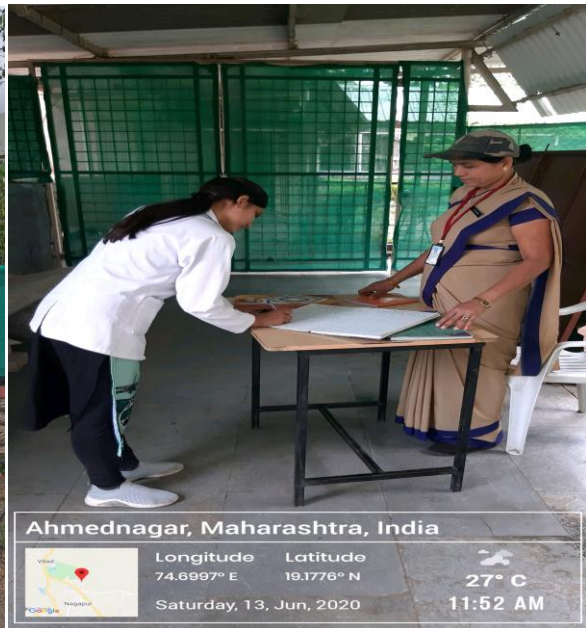
GIRLS HOSTEL –with lady security guard & CCTV camera